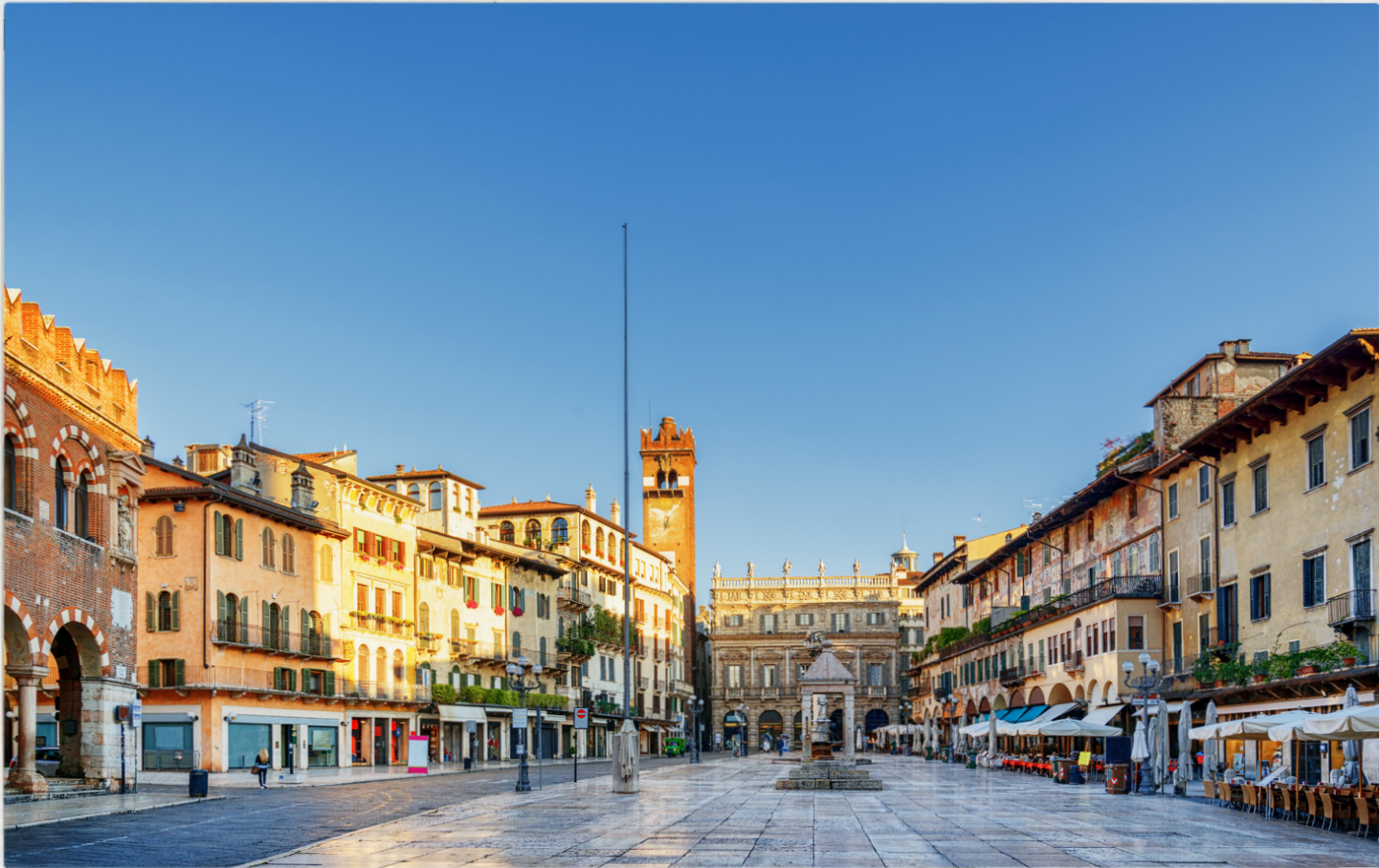
Piazza delle Erbe all'alba

Questa vivace piazza visitata la mattina presto evitando la folla e ammirando l'atmosfera tranquilla e autentica sarà in grado di evocare delle emozioni uniche! Piazza delle Erbe è una delle principali piazze del centro storico di Verona, situata nel cuore della città. Risalente all'epoca romana, era il foro principale della città. La piazza è circondata da edifici storici dai colori vivaci con facciate affrescate. Esplorare la piazza all'alba permette di ammirarla in tutta la sua bellezza in un momento magico della giornata.