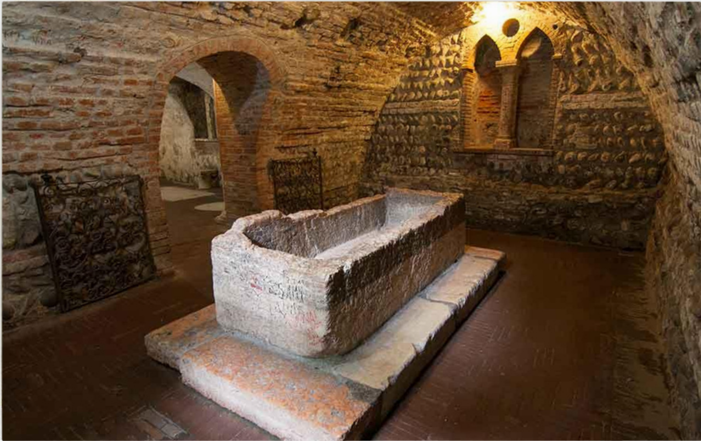
Tomba di Giulietta

Una meta non per tutti, ma se si vuole vivere al 100% la storia d'amore più drammatica di tutti i tempi, il Sepolcro di Giulietta è un must.