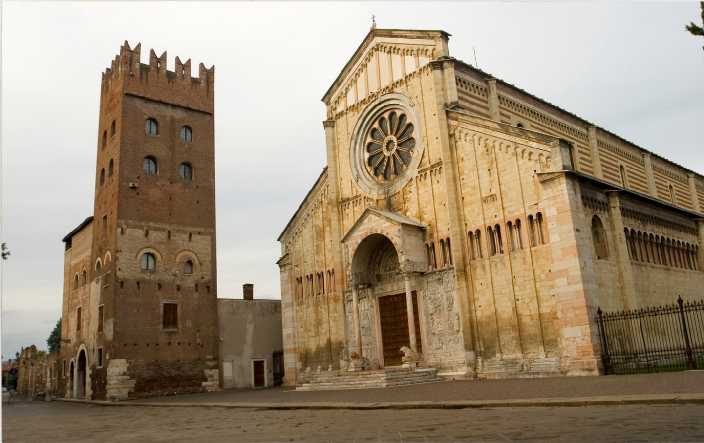
San Zeno Maggiore

Questa chiesa romanica è uno dei luoghi di culto più importanti di Verona ed è famosa per i suoi rilievi in bronzo e il suo campanile.