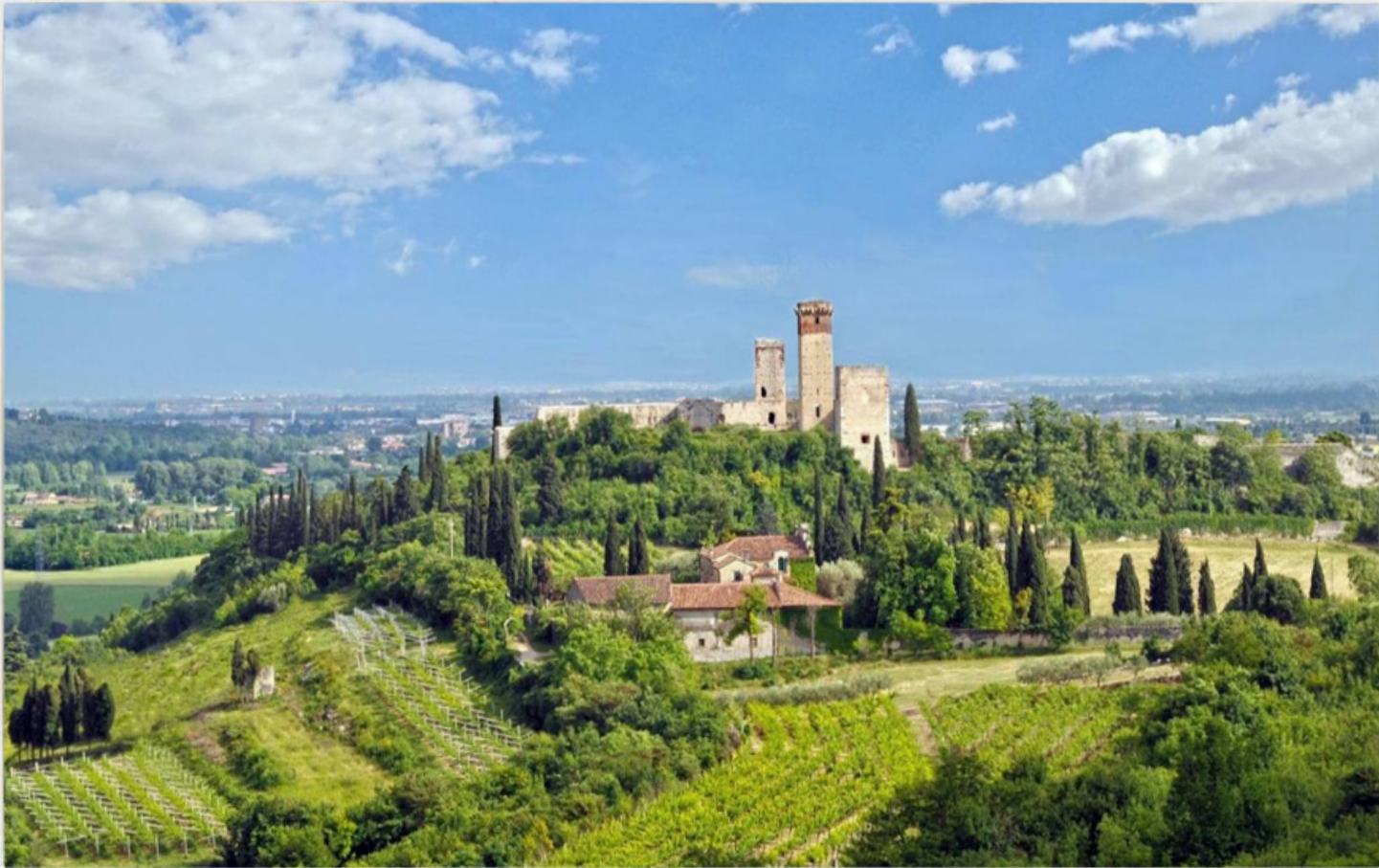
Castello di Montorio

Situato appena fuori Verona, questo castello del XIV secolo è un luogo affascinante che rispecchia imponente architettura medievale con torri e mura in pietra.