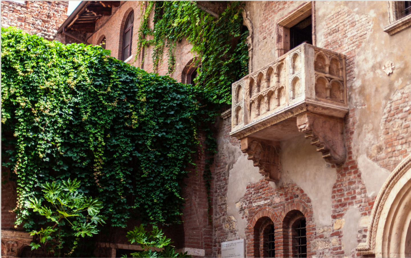
Casa di Giulietta

Situata vicino all'Arena, la casa di Giulietta è un altro luogo iconico della città.