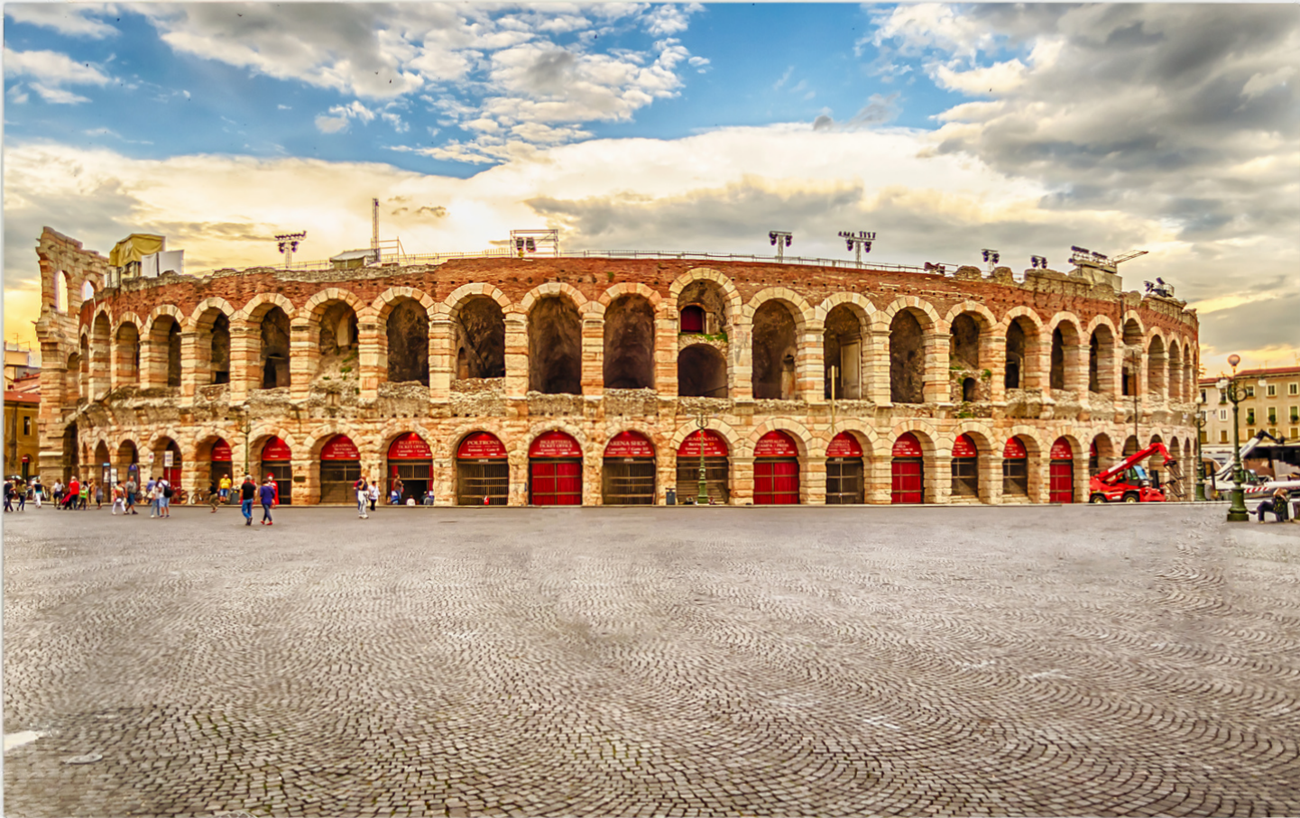
Arena di Verona

Verona offre diversi parcheggi a pagamento nelle vicinanze dell'Arena (Parcheggio Arena, P. Cittadella e P. Isolo).